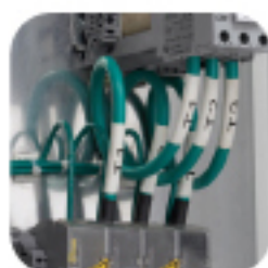
Термоусадочные маркеры провода