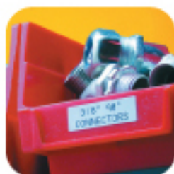
Этикетки на ящиках