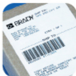
Соответствие отгрузочным требованиям