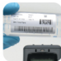
Идентификация медицинских/лабораторных материалов