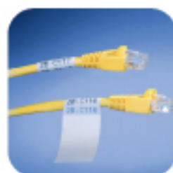
Идентификация провода и кабеля